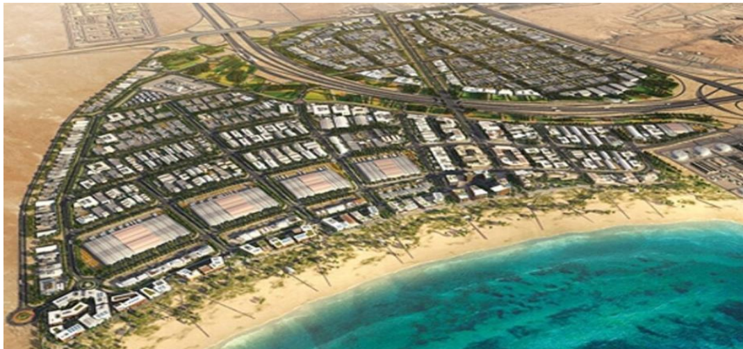
Qatar Free Zone Authority Signs MoU with US Investment Firm