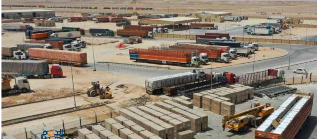
Al Mazunah Land Port receives an international code for container transport