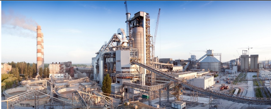
Fully Integrated Cement Plant of Falcon Cement Company (FCC) in Hafeera industrial area