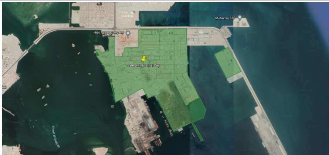
Salman Industrial City