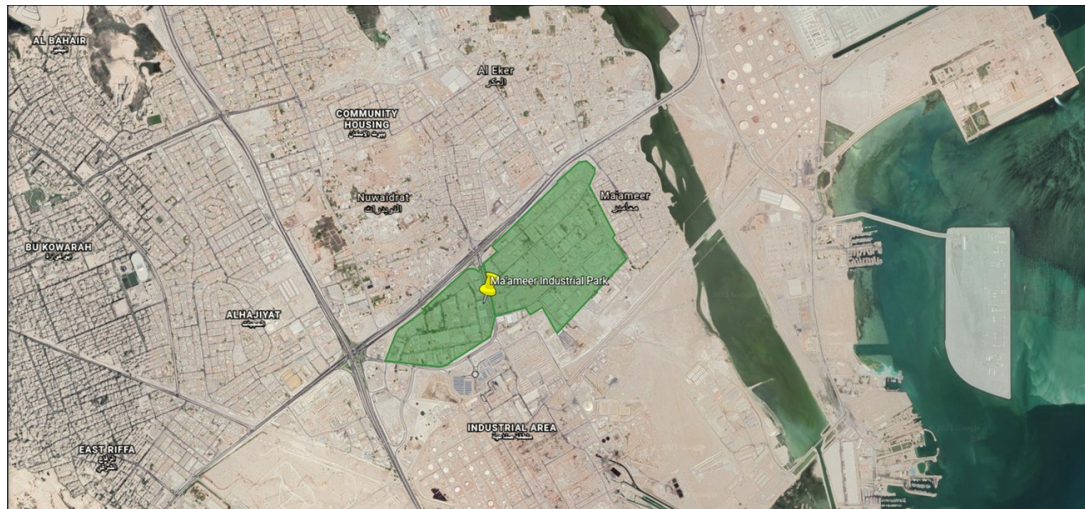
Ma'ameer Industrial Area