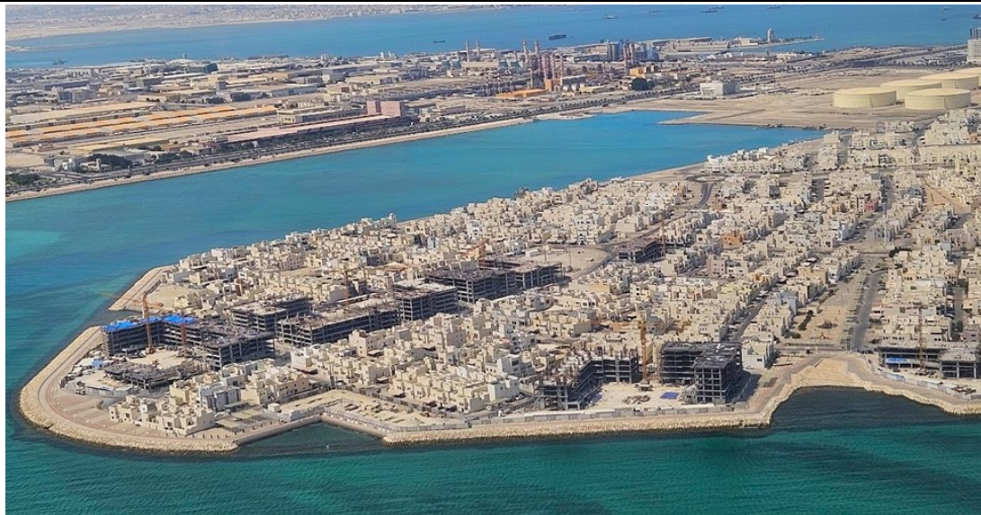
East Hidd City Aerial