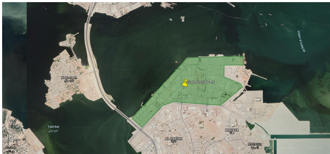
Sitra Industrial Area