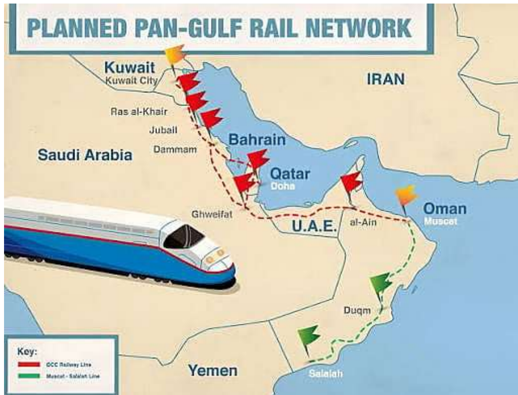
Key rail routes connecting Saudi Arabia, UAE, Oman, Qatar, Kuwait and Bahrain (December 10, 2025, Gulf News)