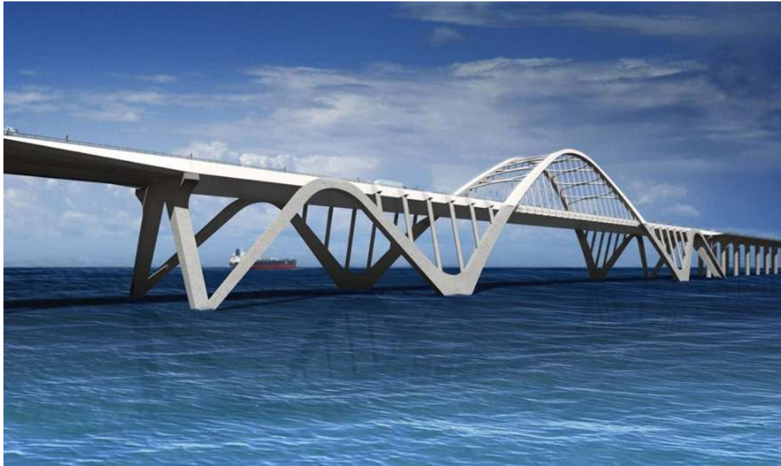
Qatar-Bahrain Friendship Bridge