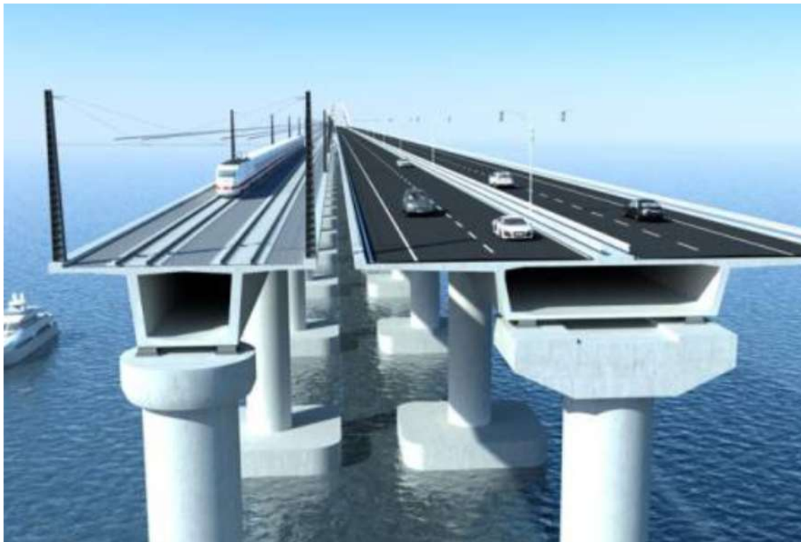
King Hamad Causeway (September 18, 2018, News of Bahrain)