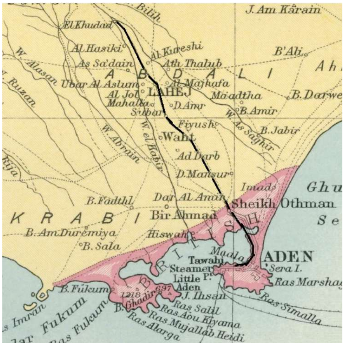
Aden Railway 1931 Map (British India Society (FIBIS))