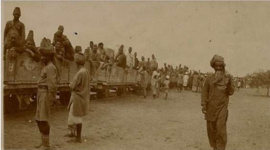
Images form Aden / Yemen 1915 – 1917 (Great War (1914-1918) Forum)