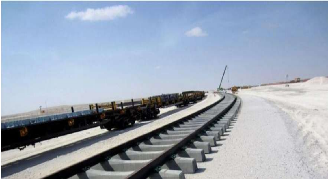
Beginning of the first phase