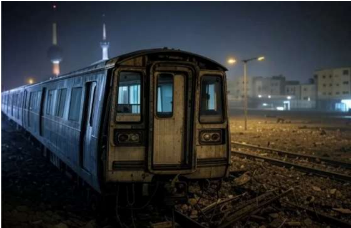
Kuwait Metro (February 01, 2025, Kuwait Local)