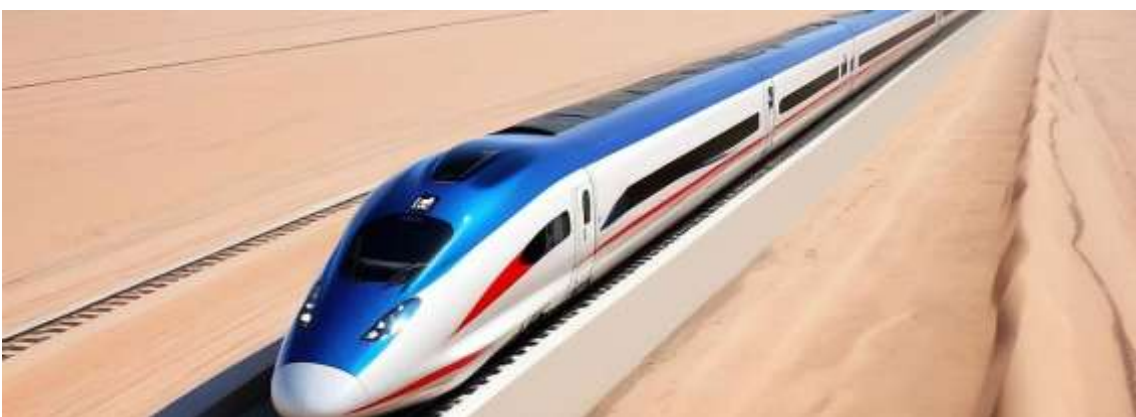
Passenger trains to run at 200 km/h

Passenger trains are planned to run at 200 km/h and freight trains at 120 km/h. This line is part of a larger 575 km national network that will connect Kuwait City (مدينة الكويت), Boubyan Port (ميناء بوبيان), Iraq border (الحدود العراقية), and future inland routes.